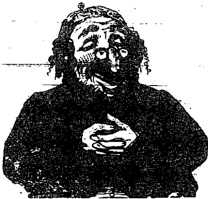
Egy lajtántuli jó atyafi.