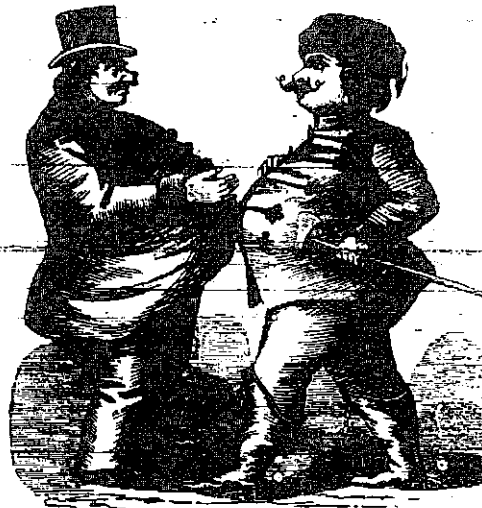
A két sovány.