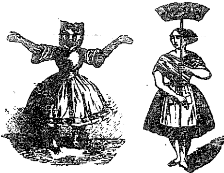
A dublini kérész aidalradai alelnök és tisztelíja.